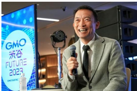
オープニングセッション/長谷部 健氏 (渋谷区長)

前回の「GMO 渋谷FUTURE 2023 - GMO SONIC Warm Up -」は、「渋谷から未来を変える、渋谷の未来をブーストする！」をテーマに開催し、会場となった東京・渋谷のグループ第2本社内「GMO Yours・フクラス」には、およそ1,000人の観客が集まり、大盛況となりました。(URL : https://www.gmo.jp/news/article/8168/ )