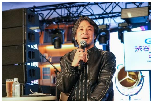
パネルディスカッション/ひろゆき氏