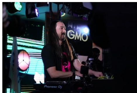
スペシャルパフォーマンス/スティーヴ・アオキ氏 (Steve Aoki)