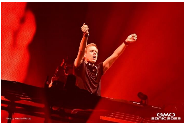
• Armin Van Buuren